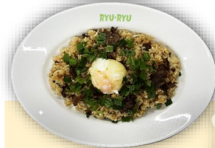
牛肉としそのバターライス 半熟玉子のせ

Fried rice with beef & shiso herbs, topped with half boiled egg