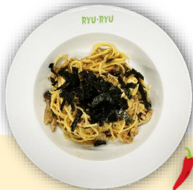
辛子めんたいこきのこ

House's original spicy salted cod roe & mushrooms, topped with nori seaweed