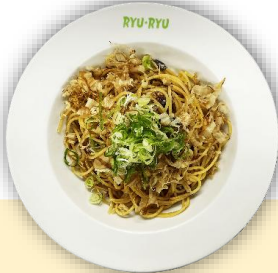
オイルサーディンコンビーフ (醤油味)

Oiled sardines & corned beef, topped with fresh green onions & bonito flakes