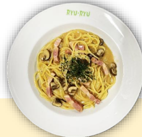
マッシュルームとベーコンの クリームソース