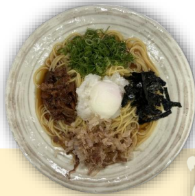
スジ玉ぼっかけスパゲティ

Beef tendon & green onions, nori seaweed, bonito flakes with half boiled egg